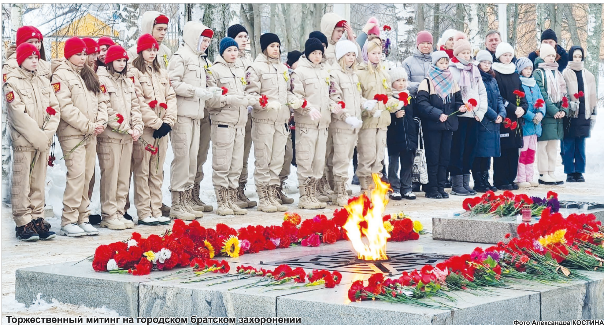
Торжественный митинг на городском братском захоронении

27 января и в преддверии этой даты в Лодейном Поле и в населённых пунктах нашего района проходили торжественные мероприятия, посвящённые 80-летию полного освобождения Ленинграда от фашистской блокады