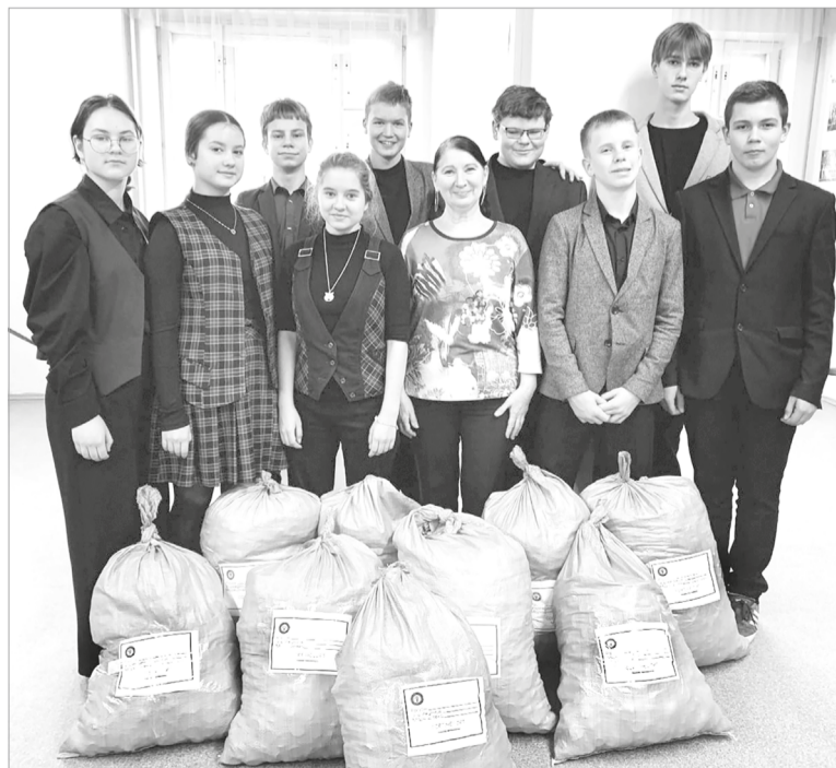
Учащиеся Лодейнопольской школы № 2 – активного участника акции