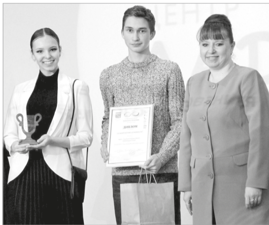
Дипломы победителям проекта: командам школ № 3 и № 2